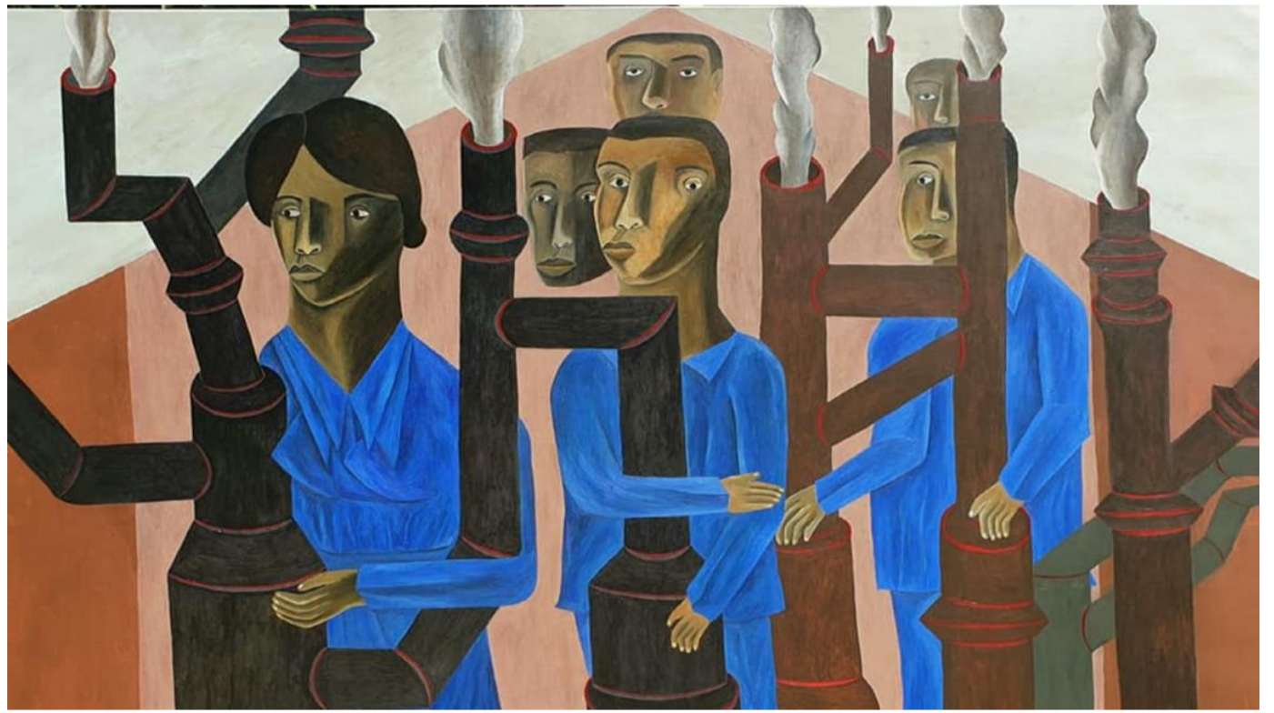
(مقطع من عمل لصلاح المرز)