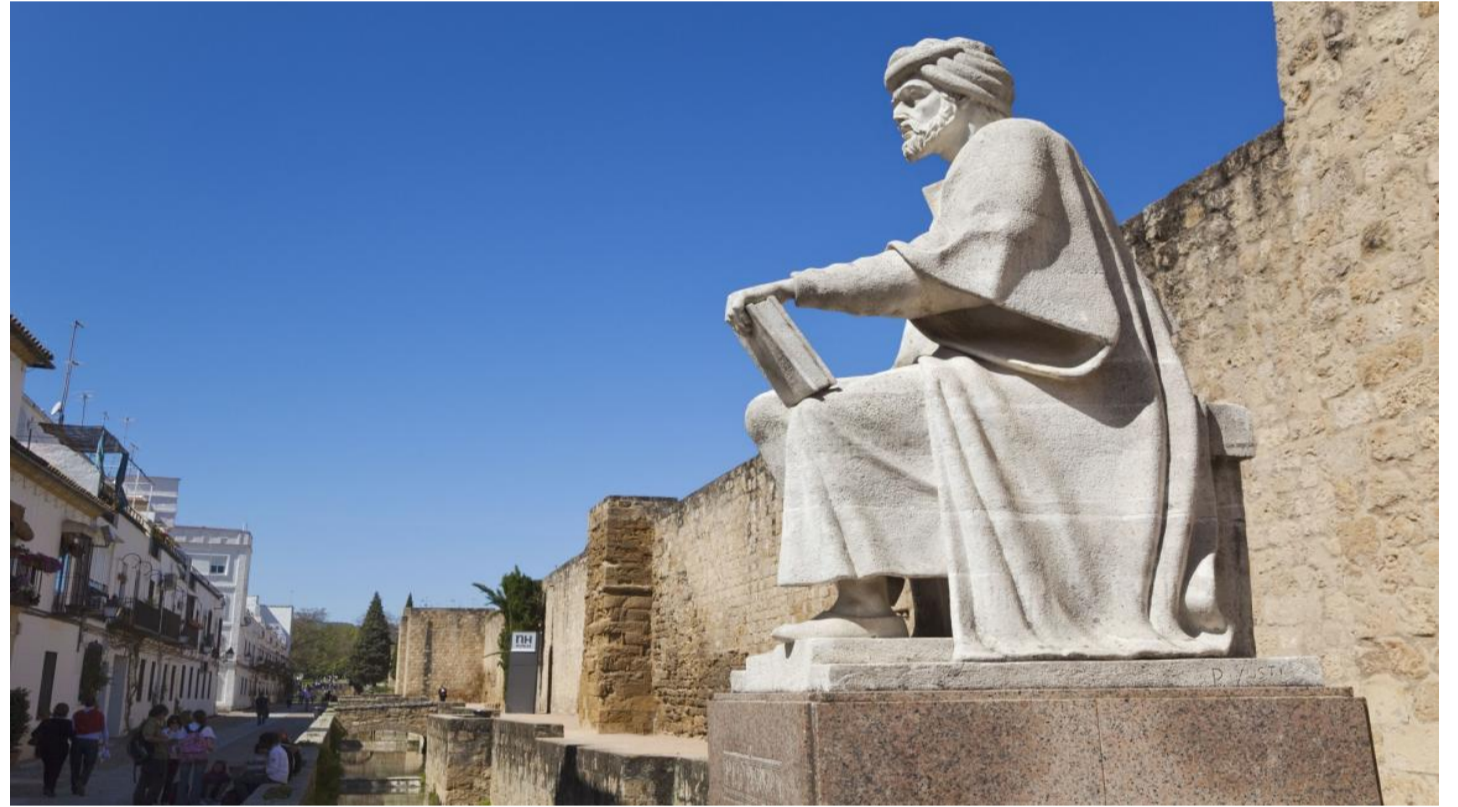
(تمثال ابن رشد في قرطبة)

6 مؤيدو بايدين يحتفلون بالألعاب النارية والقرع على الأواني